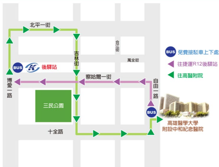
捷運後驛站(R12)接駁車時刻表 高醫啟川大樓→捷運站→高醫啟川大樓