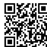
投稿 QR code