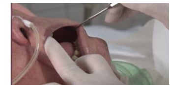
再次確認口腔還有沒有分泌物。