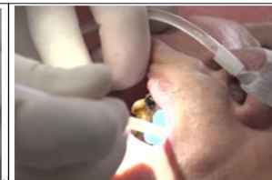
口腔照護第一分鐘，使用海綿刷沾口腔凝膠或開水潤濕口腔黏膜，海綿刷要伸至非中門牙後，用同樣方式，並請病患吞下！防止舌後部、咽喉部