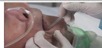
檢查口腔有沒有分泌物，若有則先抽吸清除口腔分泌物。